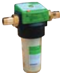
GENO®-Feinfilter FS 1"-memory

GENO®-Feinfilter FS, kein Grünbeck-Filter wurde öfter installiert. Und das mit gutem Grund, denn der GENO®-Feinfilter FS bietet außer-